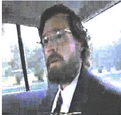
• Steve Balmer